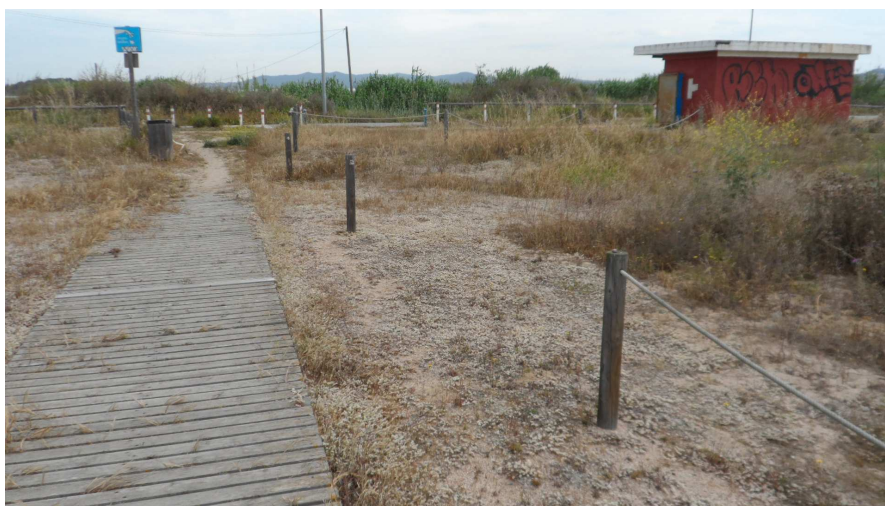
Foto 5. A tocar de la passera de TN1 hi ha 3 segments de corda desapareguts