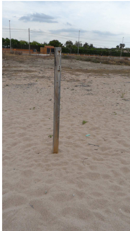
Foto 10. Senyalització vertical sense el panell normatiu a TN3