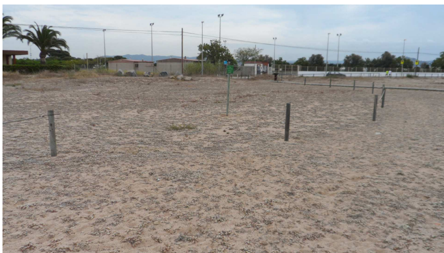
Foto 4. Al centre de la imatge s'observen els dos trams sense corda, ja prop de l'extrem nord del TS3