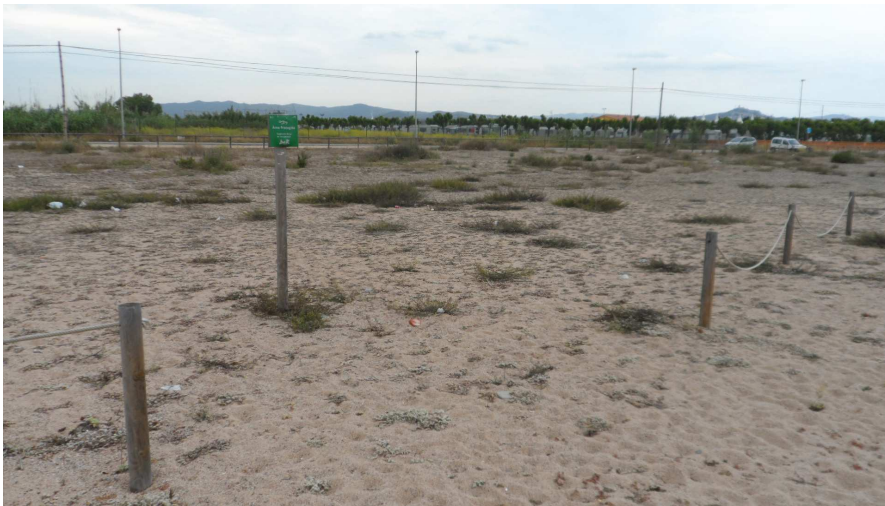
Foto 7. Al centre del tancat TN1 falta un segment de corda