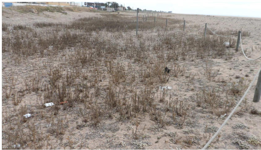
Foto 13. Deixalles a l'extrem sud de TS1