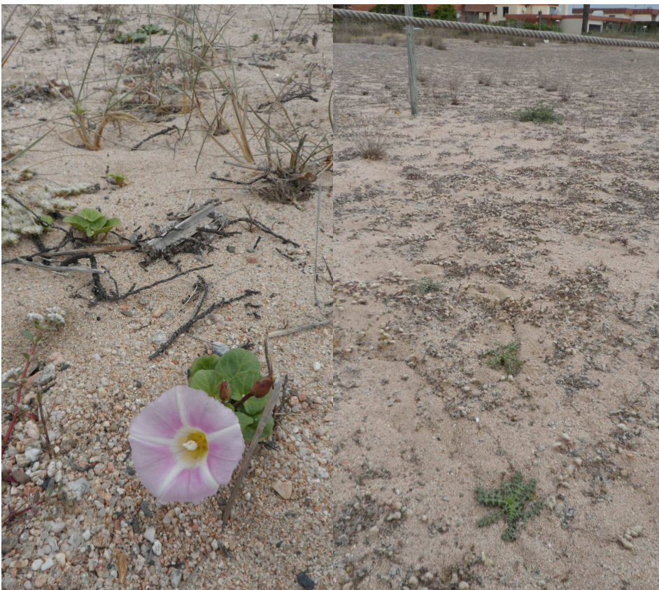
Fotos 19 i 20. A l'esquerra, un dels exemplars de campaneta de mar en flor, fora tancat TS2. A la dreta, dos peus d' Echinophora spinosa , a la part inferior de la imatge, colonitzant el fora tancat