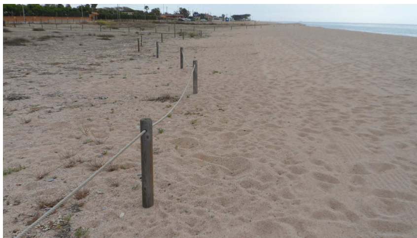
Foto 16. Als tancats nord, per exemple, la maquinària de neteja de platja arrana tant que no permet, gairebé, l'existència de vegetació fora del tancat