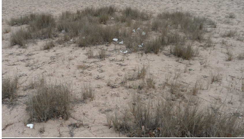
Foto 14. Algunes deixalles, entre les mates de jull de platja, a TS3