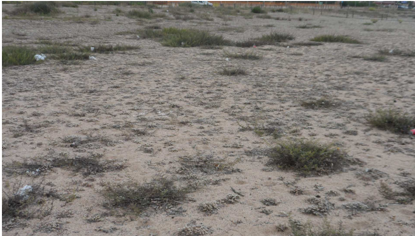
Foto 15. Fora del tancat TN1 hi ha deixalles escampades