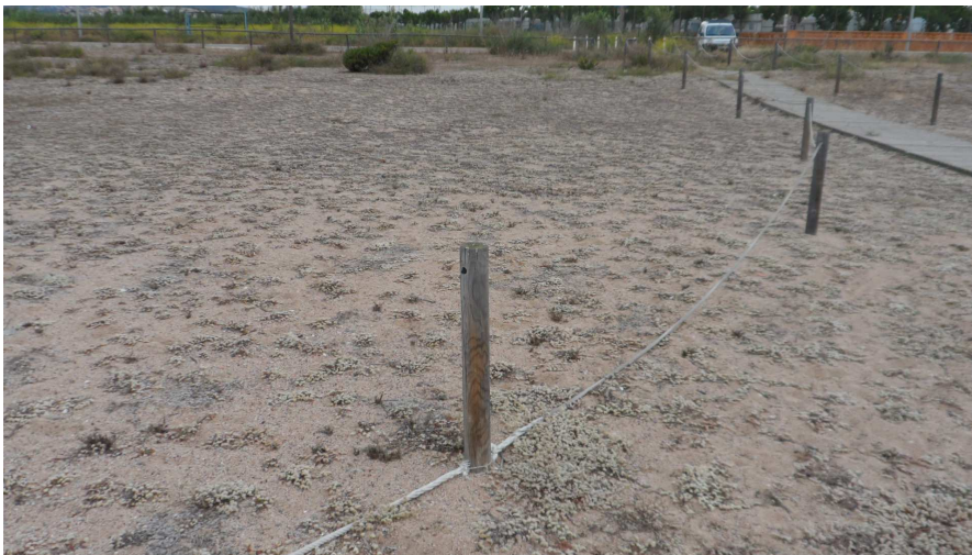
Foto 8. A l'extrem nord del TN1 hi ha un tram de corda desempalmat