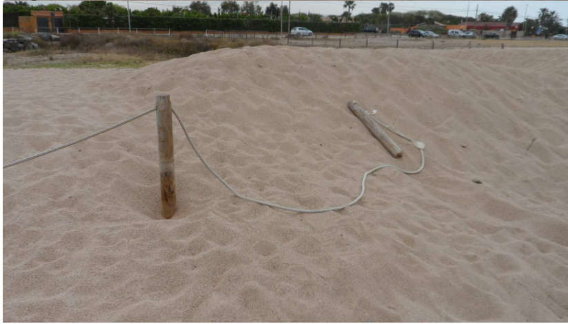
Fotos 11 i 12. Les estakes de l'extrem nord del tancat TN3 es troben molt colgades per la sorra així com una de les estakes arrencades