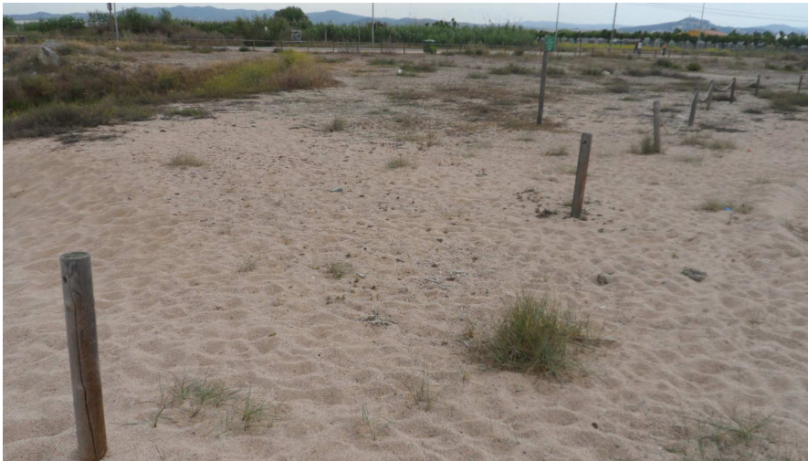
Foto 6. Al TN1, molt a prop de la riera sud, hi ha 2 segments de corda desapareguts