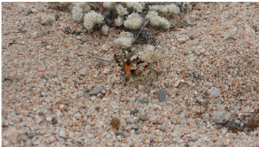
Foto 23. En el moment de la visita diversos exemplars de la papallona migradora del card ( Cynthia cardui ) han estat vistos utilitzant la platja com a punt de repòs en la ruta migradora