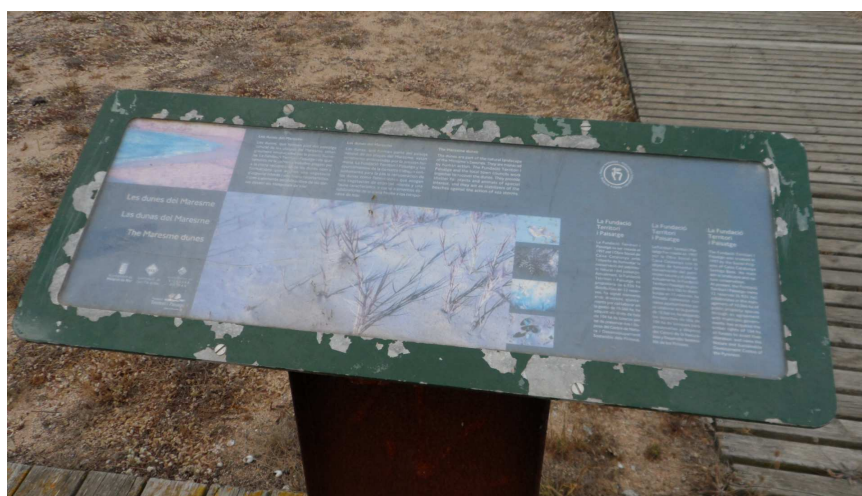
Foto 2. Faristol a l'extrem nord del TS3