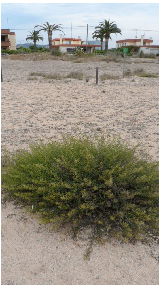
Foto 21. Matada de Scrophularia canina a TS3, fora tancat. El procés de colonització d'aquesta espècie és també lent però inexorable