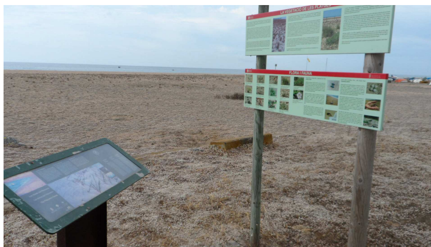
Foto 1. Faristols a l'extrem sud de TS1. Al faristol simple li caldria una mà de pintura