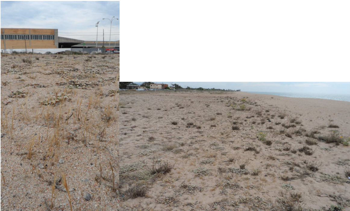
Fotos 17 i 18. La gramínia Vulpia membranacea , que rossega, colonitza el front de fora el TN1. Al centre de la imatge de la dreta s'observa el color ros d'aquesta espècie