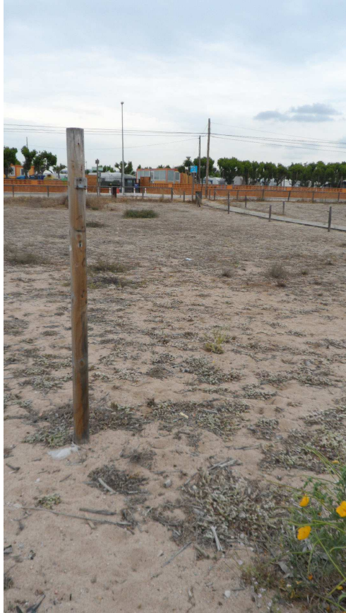
Foto 9. Senyalització vertical sense el panell normatiu a TN2