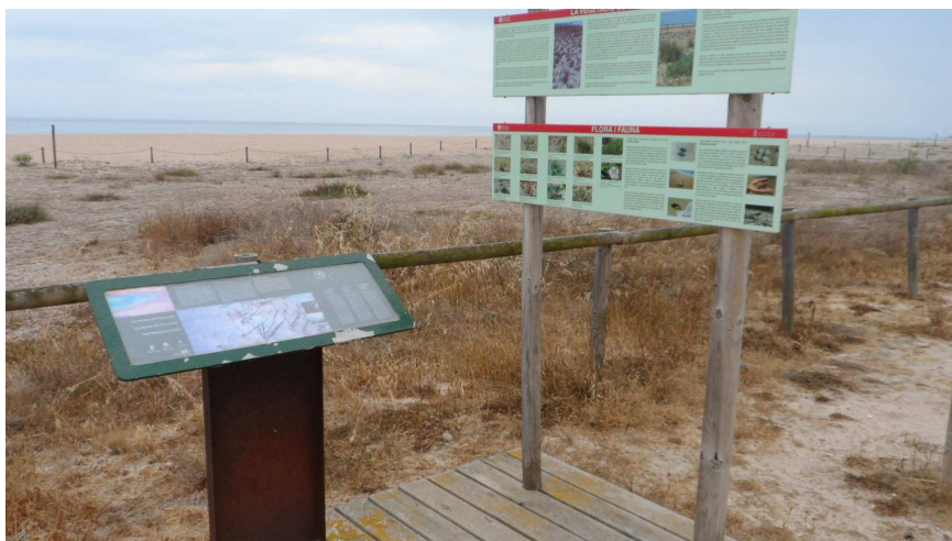
Foto 3. Faristols als TN. Convindria una mà de pintura faristol simple