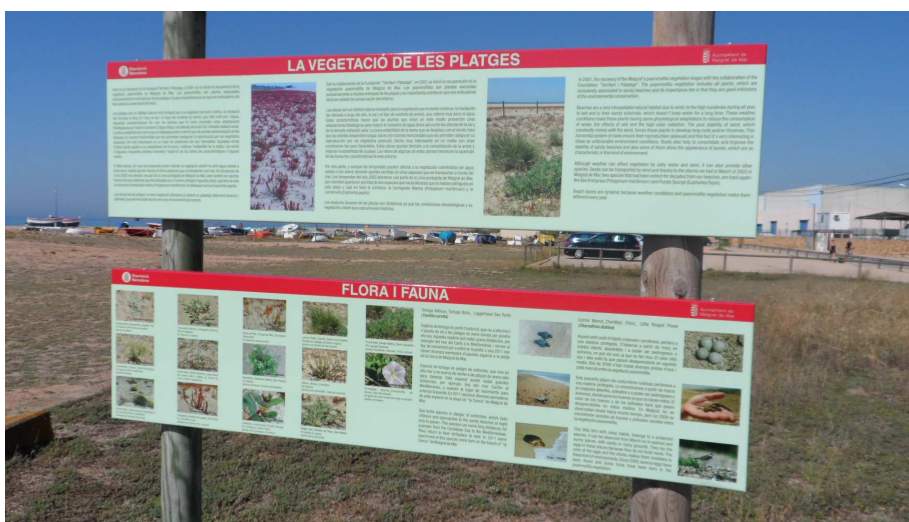
Foto 2. Nous panells amb nous continguts. TS1