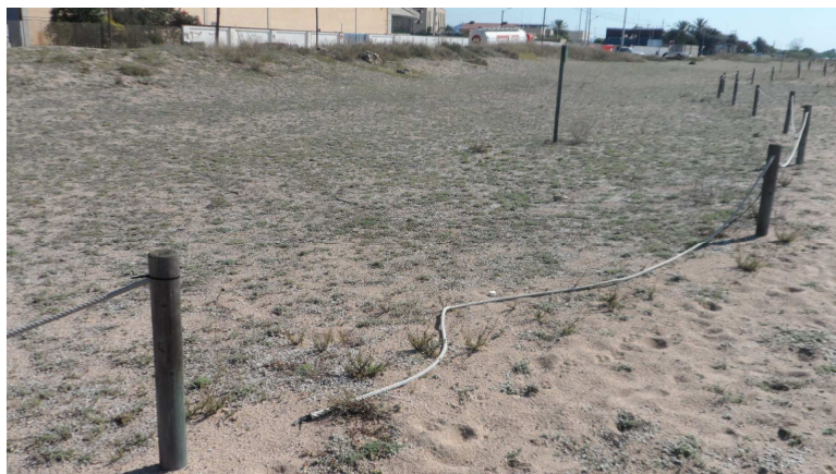
Foto 1. Segment de corda segat a l'inici del TS1