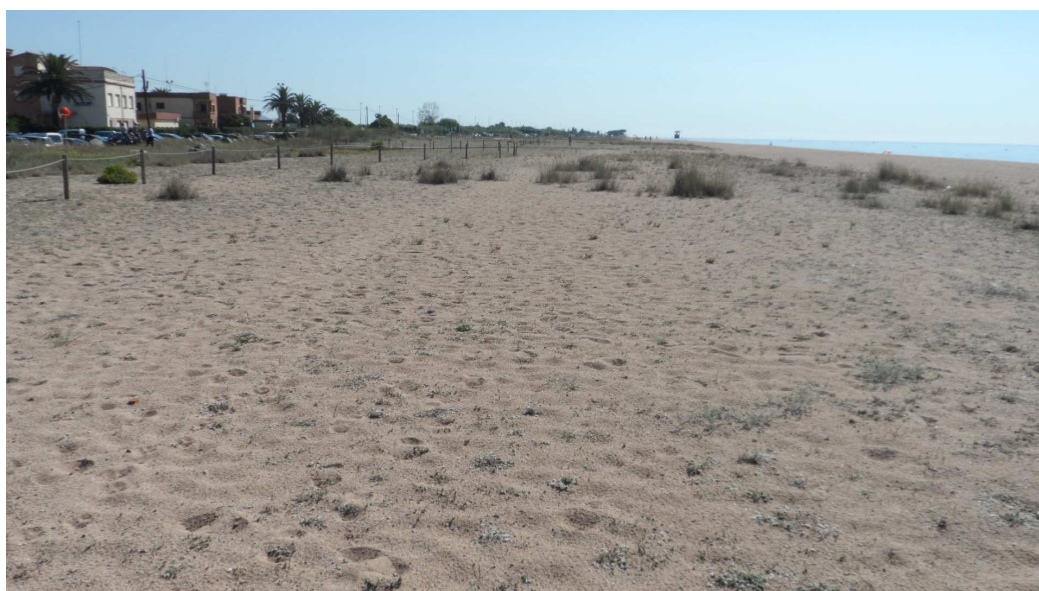
Foto 15: Vista transversal enfront dels TS. Les mates destacades del jull de platja colonitzen progressivament la platja i donen fe a cop d'ull del procés continuat de naturalització de la platja