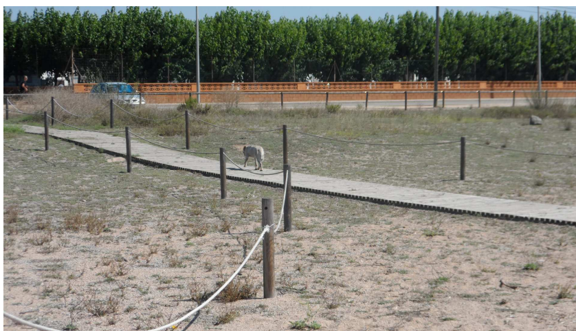
Foto 4: En una de les estakes, poc abans de la passera, la corda no passa pel forat. TN2. S'hi observa un gos deslligat, un dels problemes importants per a la conservació dels ocells més valuosos a la platja (terrerola i corriol camanegra)