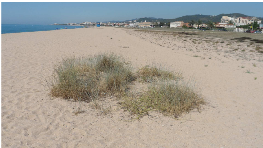
Foto 11: Aquest rodal de vegetació psamòfila, dominat pel jull de platja, s'ha salvat pel fet que les gramínies eren un obstacle massa important al pas de la màquina de neteja de la platja. S'hi observa prou bé la superfície d'ocupació de vegetació (i les espècies que hi eren presents) que s'ha perdut pel fet d'ampliar l'àrea afectada pel pas de la màquina.