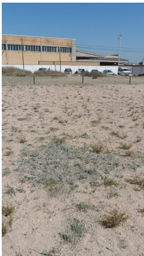
Foto 12: L'únic rodal, o gairebé, del melgó de mar ( Medicago marina ) a la platja de Malgrat es troba situat fora del tancat. Si la màquina de neteja arrana més el farà desaparèixer