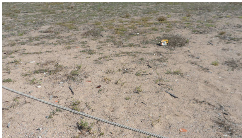
Foto 9: Alguna deixalla empesa pel vent. La ocurrència d'aquest impacte és, hores d'ara, molt baixa tot i ser en època d'ús intensiu de la platja