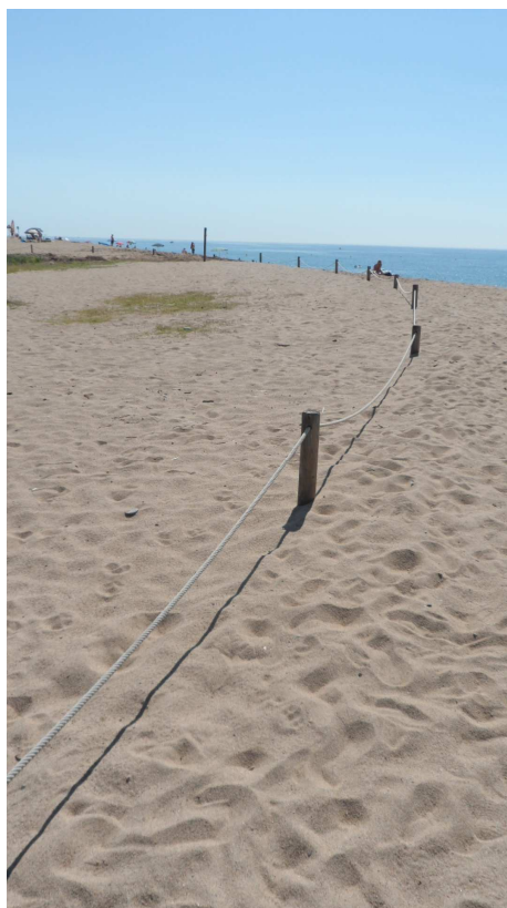
Foto 5: A l'extrem nord del TN3, els temporals han colgat les estakes