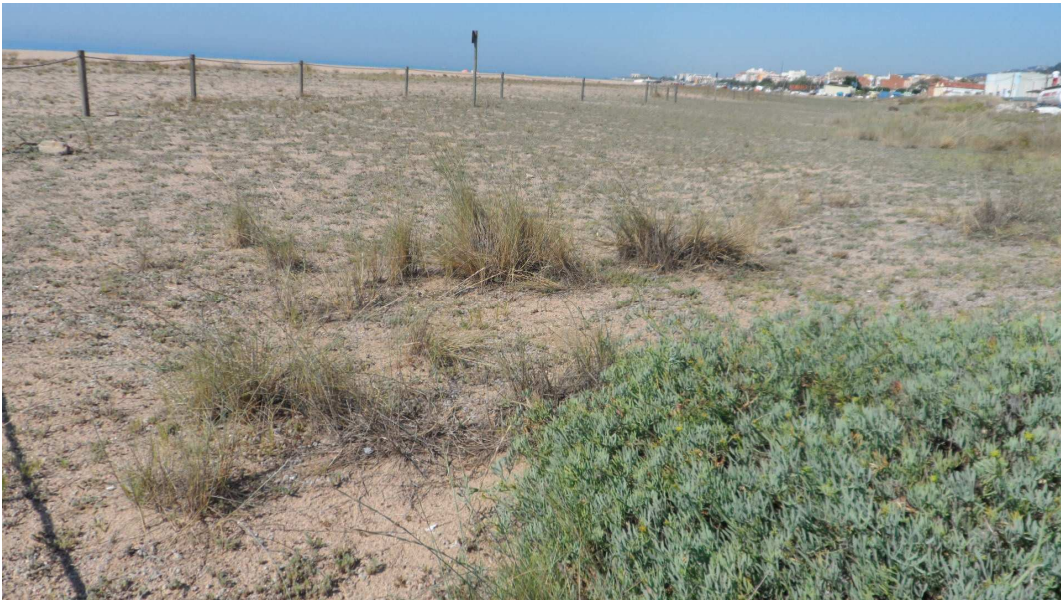
Foto 8: A primer terme, mata de fonoll marí, i a segon terme, la gramínia jull de platja. Com es pot observar la naturalitat de l'espai és alta, i l'impacte de les deixalles és nul, localment baix a tot estirar