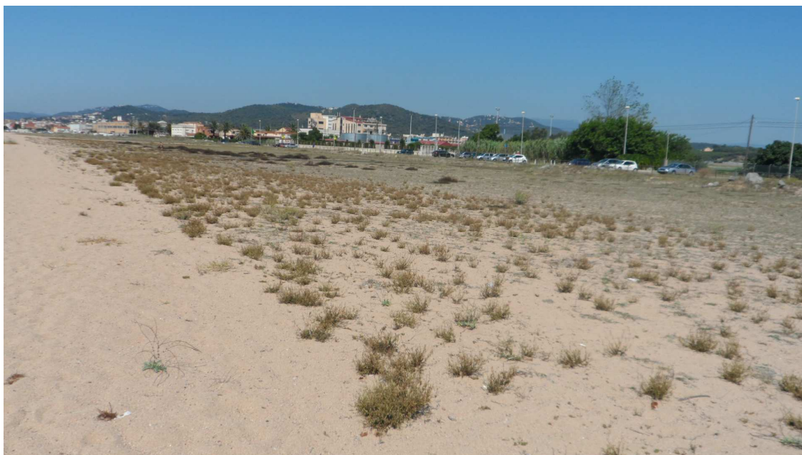
Foto 14: Amb el pas del temps s'estableixen clarament, si més no, dues bandes de vegetació. L'absència del pas de la màquinaria per la platja permetria que se n'establissin probablement fins a 4, i milloraria els valors paisatgístics i naturals de la platja