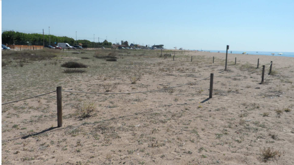
Fotos 6 i 7: Aspectes il·lustratiu dels tancats nord, amb un estat de conservació del mobiliari i dels elements de tancament molt bo