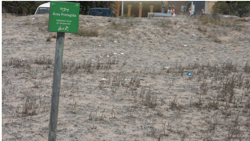
Foto 14. Deixalles a l'extrem sud del tancat