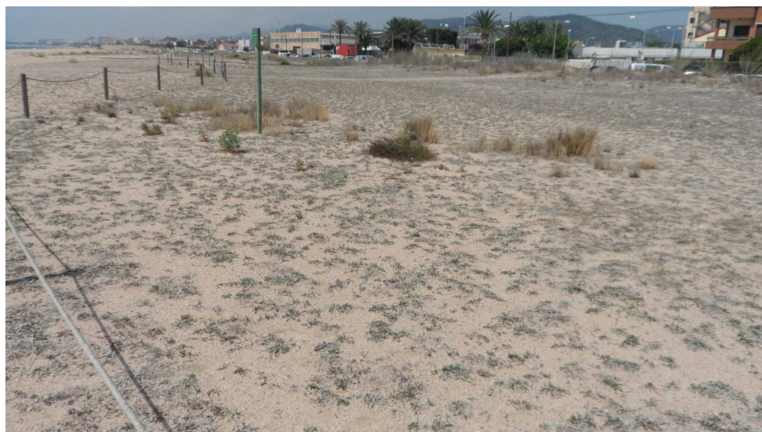
Foto 15. Aspecte dels TS3, a tall d'exemple. Les deixalles hi són molt escasses