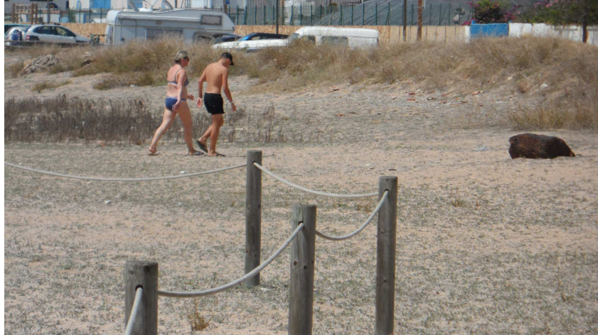
Foto 17. Banyistes travessant pel centre del tancat TS1. Aquest, especialment llarg, té més d'un punt de pas il·legal