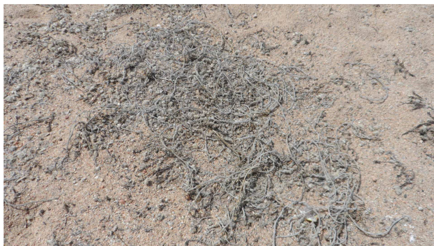
Foto 22. Aspecte actual del melgó marí, del tot bronzit per la secada. És previsible que rebroti en millorar les condicions de l'hàbitat