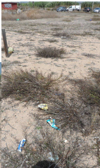
Fotos 12 i 13. Deixalles al centre (horitzontal) i al sud (vertical) del TN1