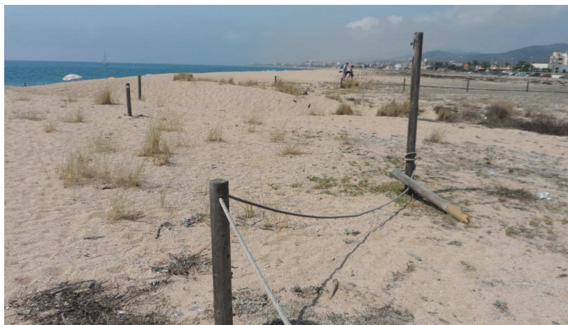
Foto 6. TN1. Suport sense el rètol de normes de conducta. A banda, una estaca arrencada i la corda, també