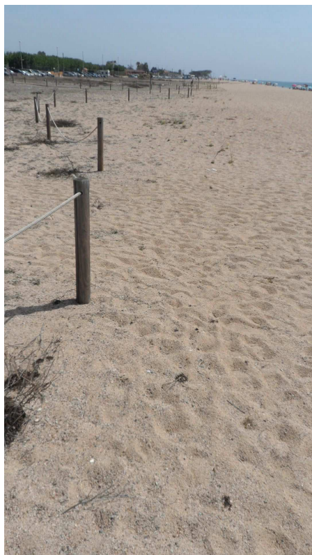
Foto 20. Al TN1, la màquina passa tant arran del tancat que la platja no protegida resta erma de vegetació. Els banyistes, en canvi, es troben molt lluny de l'àrea batuda per la màquina