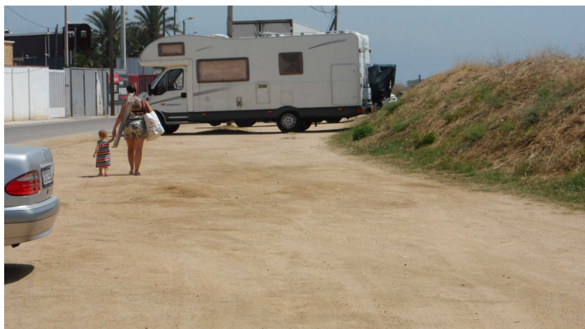
Foto 19. Mare i filla que han de fer marrada, a contracor, per no trepitjar l'àrea protegida