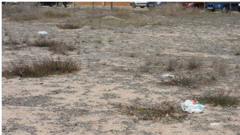
Foto 11. Algunes deixalles enlletgeixen l'interior del TN2