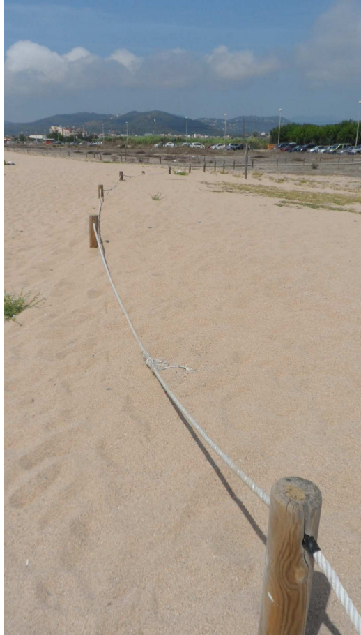
Foto 7. Estaques cada cop més colgades per les aportacions naturals de sorra a l'extrem N del TN3