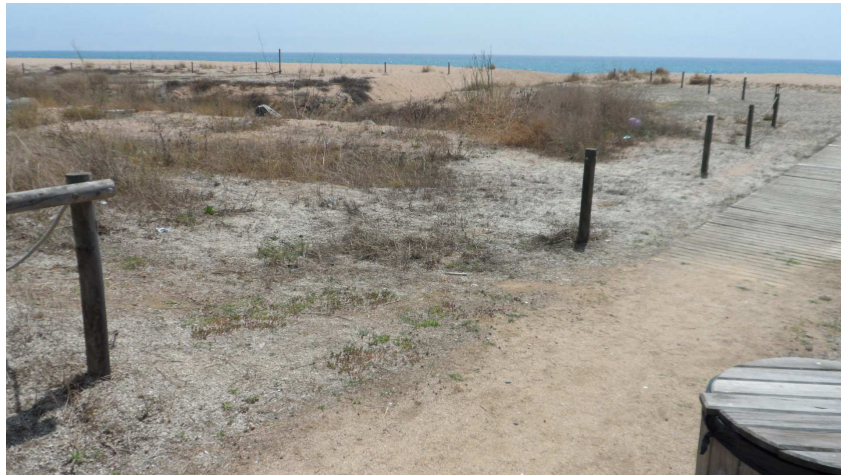
Foto 9. TN1. A l'extrem sud maquen 3 segments consecutius de corda.