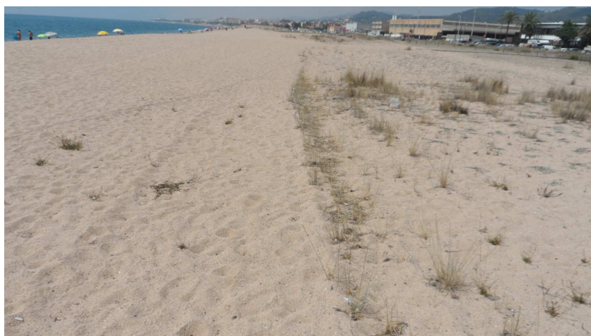
Foto 23. TS3. S'observa clarament la línia recta que deixa el pas de la màquina de neteja de la platja, que priva el creixement de la vegetació