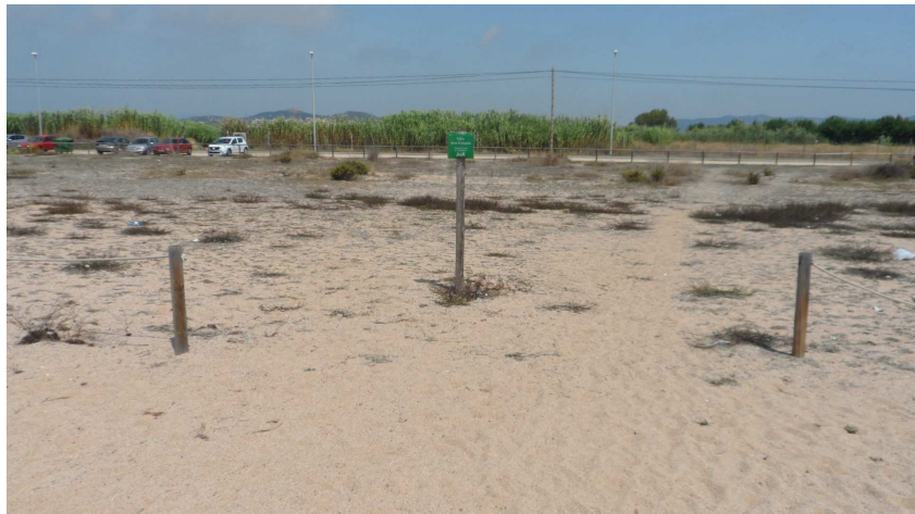
Foto 8. TN1. L'absència d'un segment de corda, al centre del tancat, coincideix amb un pas "il·legal" dels banyistes