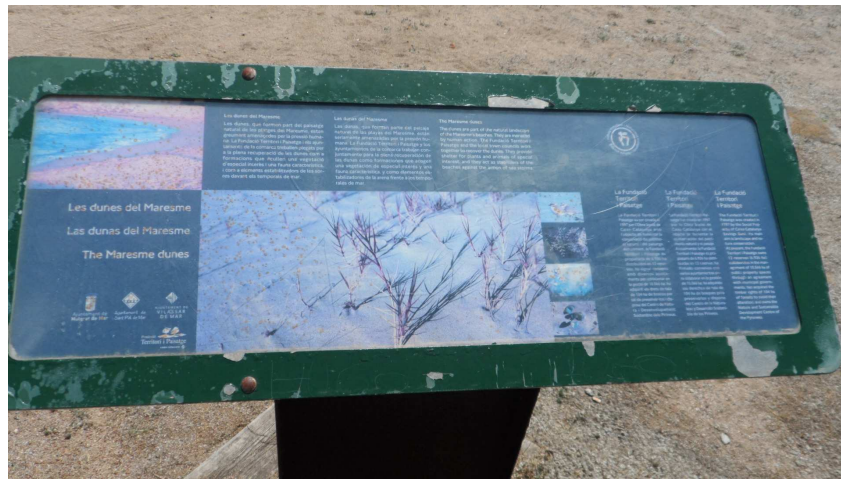
Foto 1. Faristol sud a TS1. Li caldria un repàs de pintura a les vores