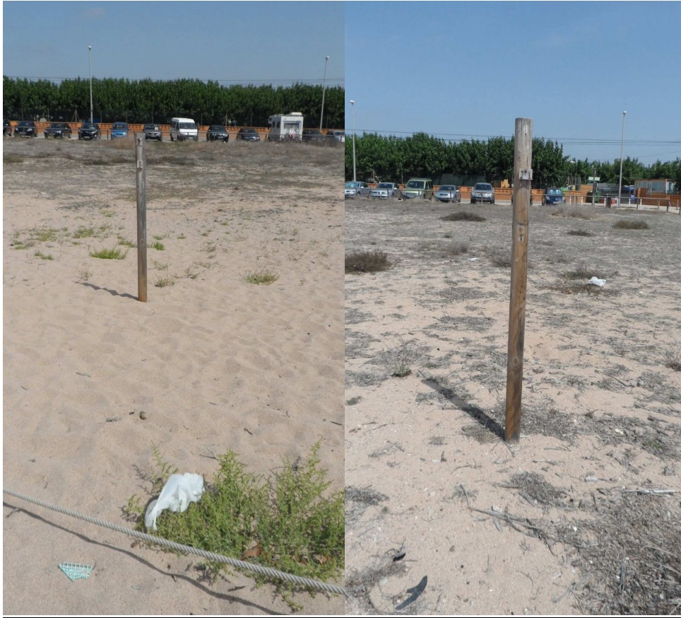
Fotos 4 i 5. Suports sense rètols de normes de conducta. A l'esquerra a TN3 i a la dreta a l'extrem N de TN2