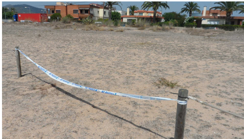
Foto 10. Segment de corda pendent de reposició a l'extrem N del TS3