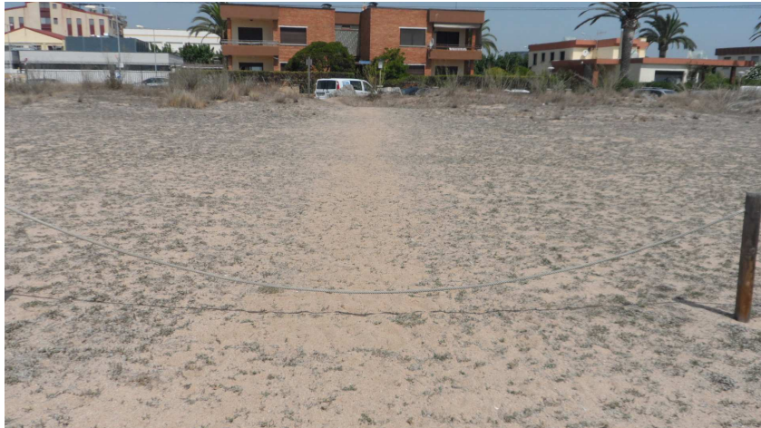
Foto 18. Pas habitual a la platja per part dels residents locals a TS3