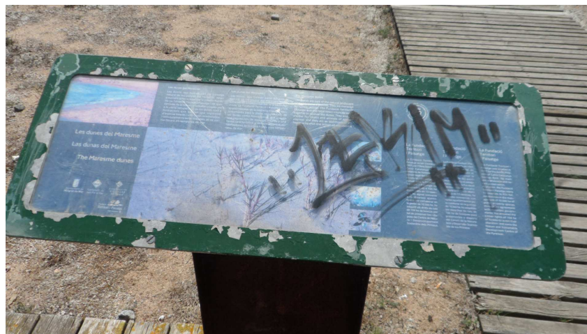
Foto 2. Faristol a TS3. Li caldria un repàs de pintura a les vores i eliminar el graffiti