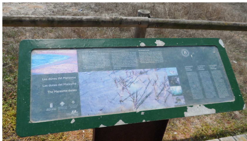
Foto 3. Faristol a TN2. Li caldria un repàs de pintura a les vores