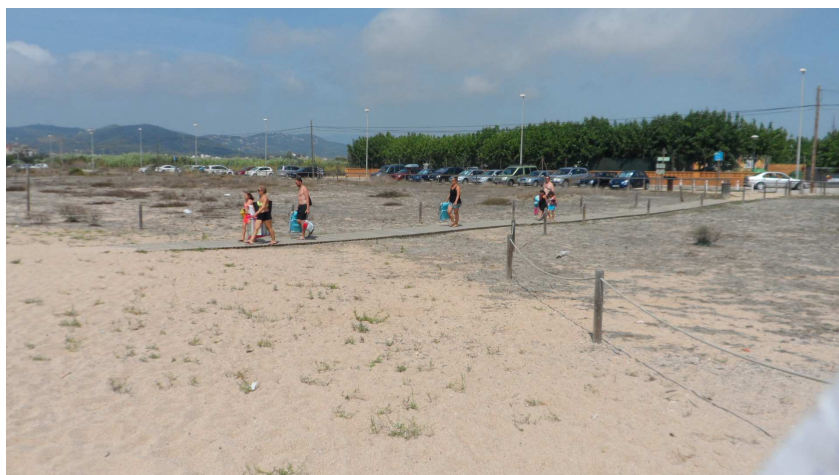
Foto 16. Usuaris accedint a la platja per una de les passeres