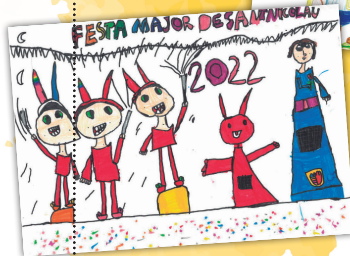
Lillet Pla de l'Escola Maristes Sant Pere Chanel SEGON PREMI.